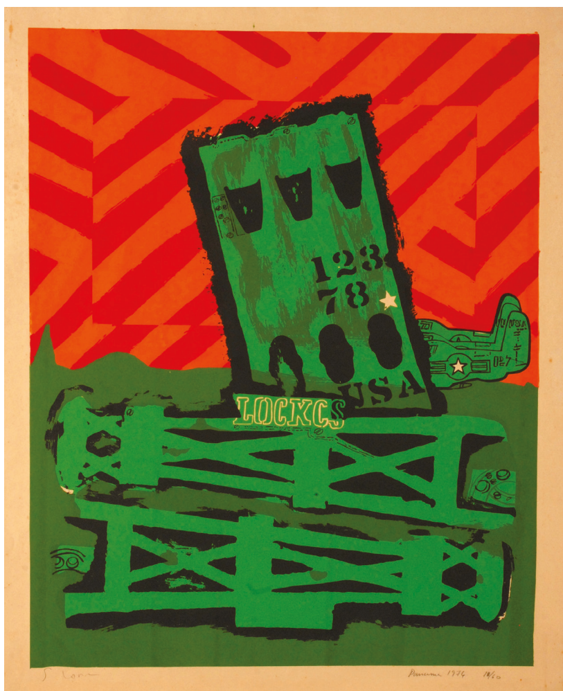
Silvano Lora (Republica Dominicană), Serigrafía (Serigrafie), 1976, tiraj 18/60. 640 x 570 mm.