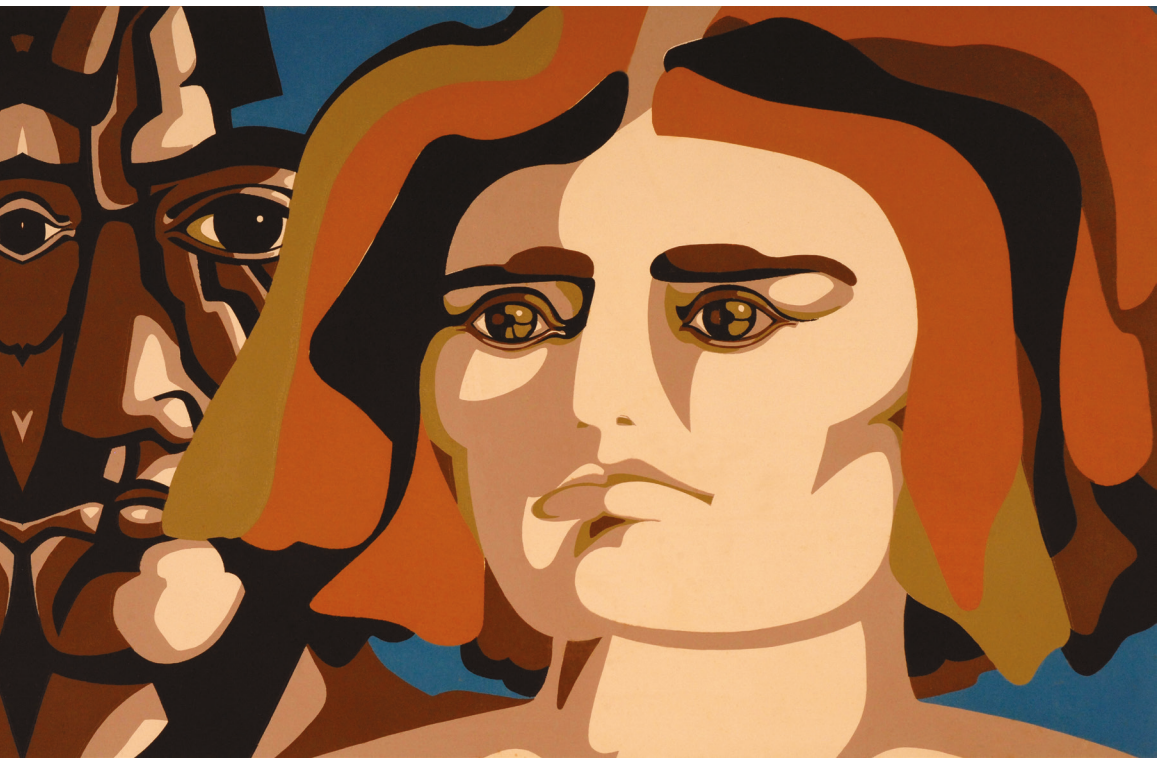
José Venturelli (Chile), Serigrafía (Serigrafie), 1970, tiraj 15/90. 260 x 430 mm.